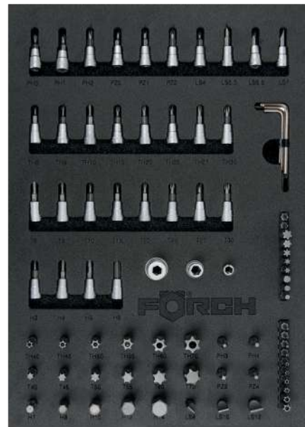
4990N 865 03