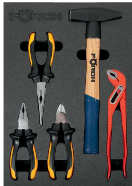
4990N 865 06