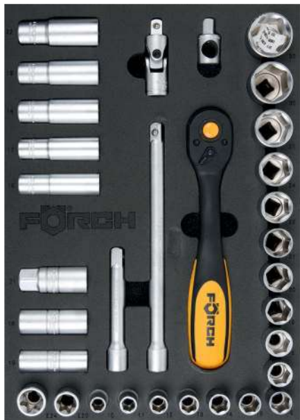
4990N 865 01