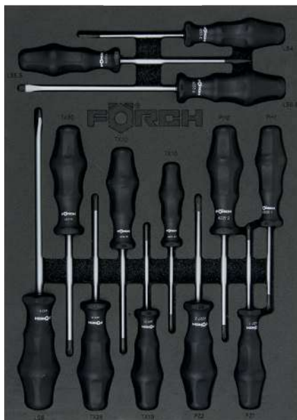
4990N 865 05