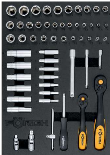
4990N 865 02